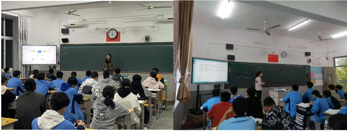
阜阳市第三中学实习