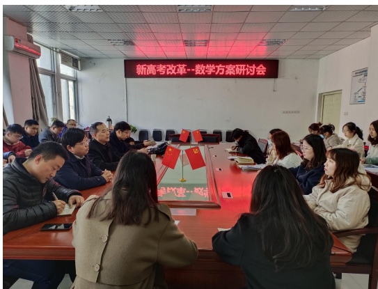
新高考改革研讨会