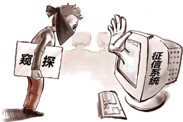
征信系统保护个人隐私

在数据使用方面，对于已经采集入库的数据，中国人民银行采取授权查询、限定用途、保障安全、查询记录、违规处罚等措施保护个人隐私和个人信息安全，商业银行只能经当事人书面授权，在审核个人贷款、信用卡申请或审核是否